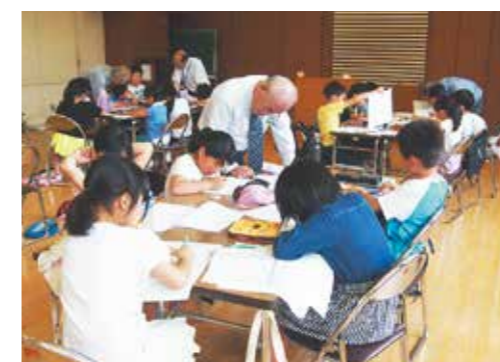
▲学年ごとに分かれて、「数」の世界を学習しました