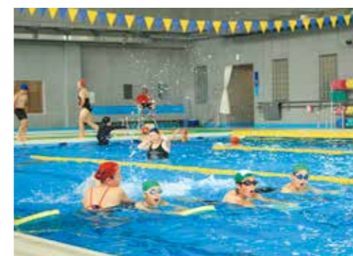
▲児童たちは「新しくきれいだ」「久しぶりで楽しい」と久々の水の感覚を楽しんでいました