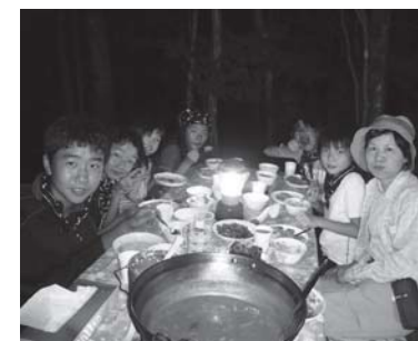
国見町の小学生とキャンプで交流