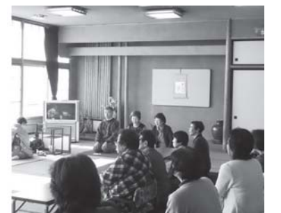
お茶の作法を学ぶ受講生