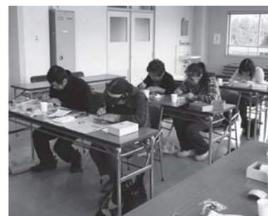
集中して石に掘り込む雅印教室