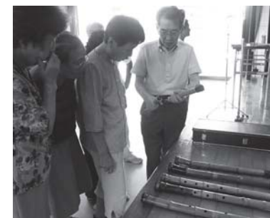
尺八の知識を深める