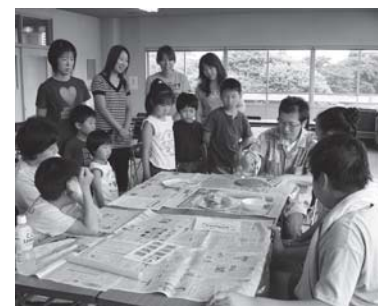
親子で体験した陶芸教室