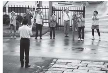
デジカメの基礎を分かりやすく学ぶ