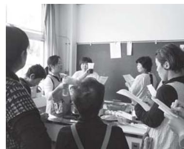
バランスよい献立で人気の韓国料理

詳しい内容については、中央公民館にお問い合わせください。 【過去に開設した例】 絵手紙、ヨガ、パッチワーク、雅印教室、韓国料理教室など。