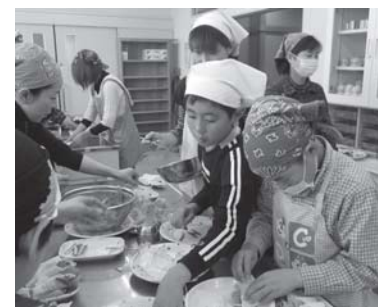
親子で楽しく料理作りに挑戦

※上記①～③の中から実施してみたい講座を1つ選んで、団体で申し込みください。詳しい内容、開催日程については、担当者と打ち合わせの上決定します。 ※各講座、申し込み多数の場合は、抽選となります。 ※講座の内容により、実費負担をいただく場合があります。