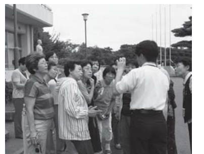
デジカメの撮影方法を学ぶ