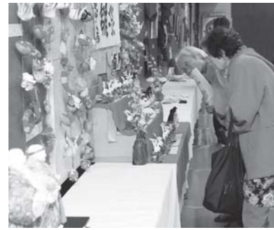
力作にじっくりと見入る来場者

町の秋を彩る第35回町総合文化祭が11月2日から4日まで、中央公民館と町民体育館、第2体育館で開催されました。およそ1200点もの作品が会場を飾った総合展示では、迫力のある書、丹精込め