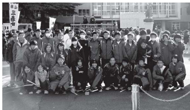
大健闘をみせた選手とスタッフ。県庁前で

それがら毎日そごさは薪置いてあつたんで、それ売つてだんだん暮らしも楽になつたんだつて。