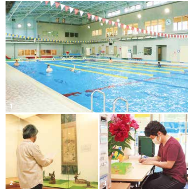
1、2_約1か月ぶりに施設再開。待ちわびた利用者が来館 3_安心して施設を利用できるように、利用者には氏名や健康状態などの記入をお願いします

町は、皆さんが安心して施設を利用できるように、予防対策を徹底しています。利用の際は、マスクの着用や、密集・密接を避けるなど、下記の注意事項へのご協力をお願いします。