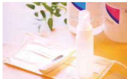
万が一に備えた感染予防対策

マスクや消毒液、間仕切り資材、屋内型避難所用テントなどを備蓄。避難所開設時の3密回避と衛生環境の保持に努めます。