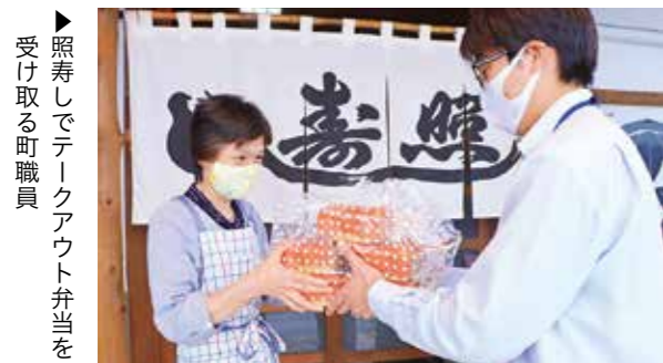
▶ 照寿しでテークアウト弁当を受け取る町職員

早くも約610人から申請があり、通院や買い物など、さまざまな場面で利用していただいています。申請手続きは、「やすらぎ園」内の健康福祉課 福祉係（☎582-1133）まで。ご利用ください。