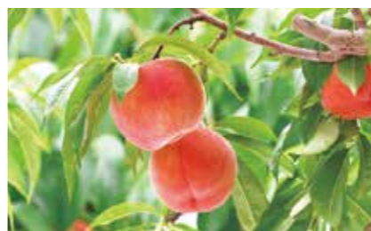
おいしい桃を買って、農家を応援

桃の需要減少に伴う農家への影響が懸念されることから、町特産桃の購入者に費用の一部を助成します。1箱5,000円以上の桃を購入した場合、1箱につき1,000円を補助します。 献上桃の産地として、農家の皆さんを応援しましょう。