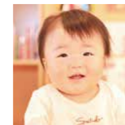
太田の のはちゃん