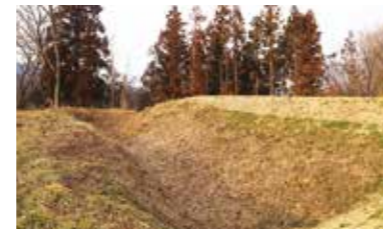
本丸と二ノ丸の間の「堀切」

【お詫びと訂正】4月号に掲載した「左沢楯山」のふり仮名に誤りがありました。正しくは、「あてらざわたてやま」です。