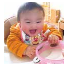
若島 湊斗くん みなと