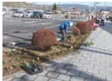
▲花を植える会員の皆さん。駅前に足を運ぶ際は、ぜひご覧ください