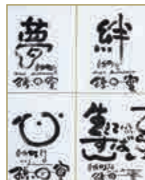
力強いメッセージが書かれたサイン色紙(町民ロビーへ展示)

また、健康測定会では、好評のベジチェックやインボディ、血管年齢測定、ストレスチェックのほか、町産「王林」を使ったビタミンスムージーの試飲、脳活トレーニングやホタピーと健康宣言のコーナー、企業ブースなどが設けられ、参加者は自身の測定を通して、健康づくりへの意欲を一層高めていました。