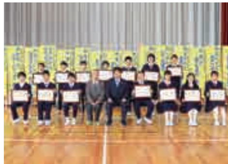
▲防災意識向上を図る標語を作り、見事優秀作品に選ばれた皆さん