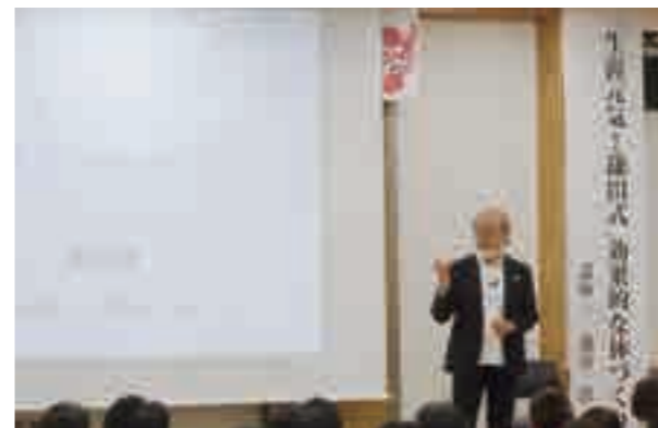
鎌田先生によるユーモアあふれる講演

「生涯元氣!鎌田式効果的な体づくり」と題した健康講演会では、医師で作家の鎌田實先生よりユーモアや実演を交えた軽妙なトークが繰り