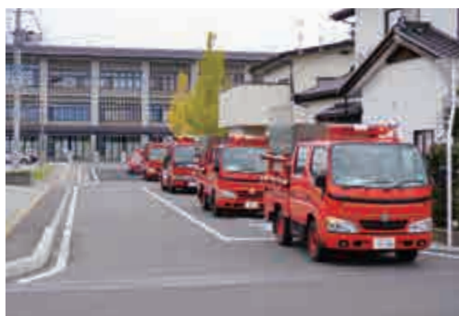
▲町内をくまなく巡回し、火の用心を呼びかけるため、役場を出発する消防車両

秋の全国火災予防運動町内パレードが11月12日、町全域で行われました。消防車両5台が出動し、消防団や女性消防隊、女性防火クラブから、約30人が参加しました。消防車両は役場を出発し、町内をくまなく巡回。女性消防隊らが「火災の