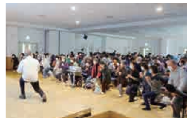
みんなで一緒に体づくり