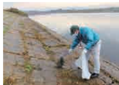
▲早朝の河川敷で行うゴミ拾いの様子。地域の皆さん一丸となって環境美化に努めます

この活動は、阿武隈川流域にある22の自治体が年1回、各町内会や事業所などの協力のもと実施しており、今年は10月29日を中心に行われました。道路や河川敷、水路などに投棄された、空き缶や廃ビニールなどの回収、雑木・雑草の刈り払いや側溝の土砂上げなどが行われ、2,500人以上の町民の皆さんが環境美化に取り組みました。きれいな町、きれいな阿武隈川を目指して、今後も継続的に実施していきます。