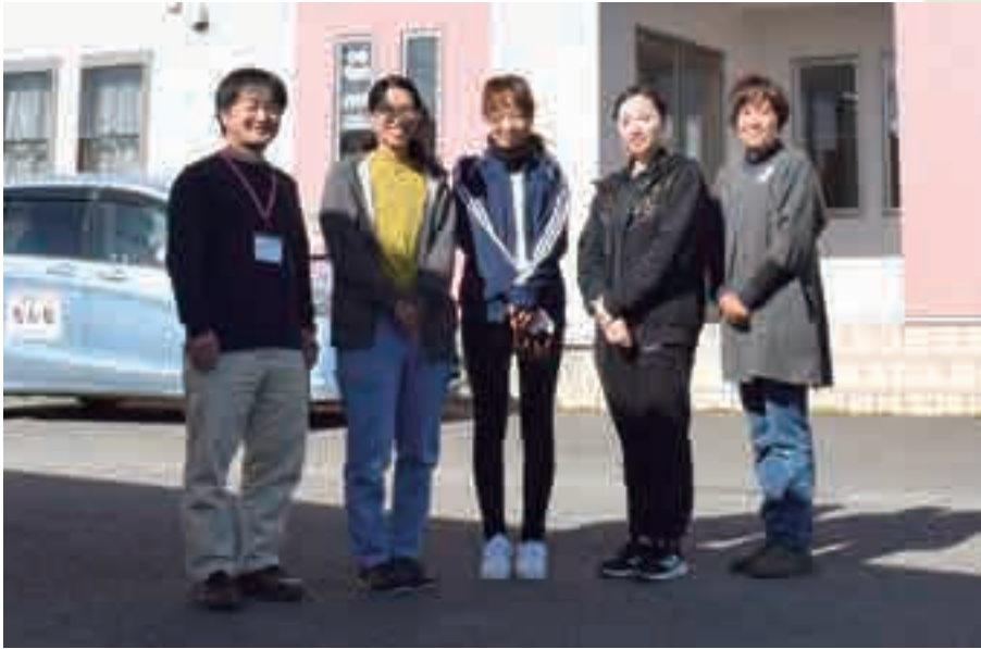
「地域の皆さんと共に、より多くの方々を支援していきたい」と語る職員の皆さん