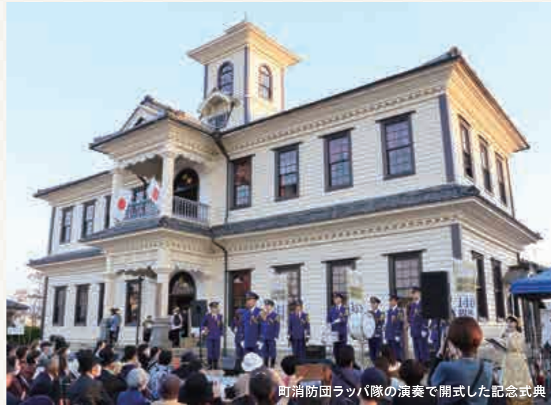
町消防団ラッパ隊の演奏で開式した記念式典