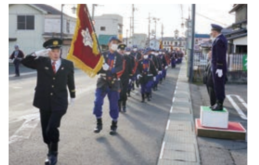
▶市中行進を行い気持ち新たに士気を高める団員の皆さん

桑折町消防団の出初式が1月7日、団員約200人の参加で行われました。女性消防隊が広報する防災活動車の先導で、団員と消防車両14台が市中行進。ラッパ隊の高らかな演奏のもと、今年一年の防火の願いを込めて歩