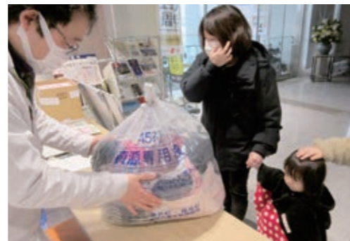
▶不要になった子ども服を持ち寄る参加者

の国々に輸出される他、ウエスに再生利用されます。町では、毎年春と秋に小型家電回収と併せて古着回収を行っています。広報紙や町ホームページなどでお知らせしますので、資源回収にご協力ください。