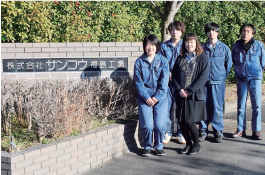
SDGsの目標達成に日々取り組む環境推進メンバーの皆さん