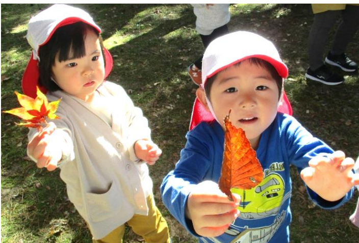
【↑葉っぱ見つけたよ～！】

外はすっかり秋模様で、葉っぱのプールに入ったり、どんぐりを拾ったりして、自然に触れて遊びました。「赤色だよ」「赤ちゃん葉っぱだね」と、葉っぱの色や形を楽しんだり、「ふわふわで気持ちいいね」と、感触を味わったりする姿が見られました。他にも、サーキット遊びや三輪車などで、体を動かして遊んでいます。室内では、少しずつ紐通しやボタンはめなどの、手先を使った遊びに取り組んでいます。