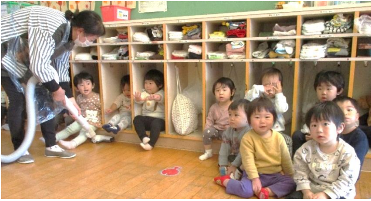
【↑お掃除の間、座って待てるようになりました】

落ち葉のプールを作って遊びました。ふかふかの落ち葉の中で座ったり寝転がったりして、全身で落ち葉の感触を楽しみました。秋にしか体験できない遊びを十分楽しみました。