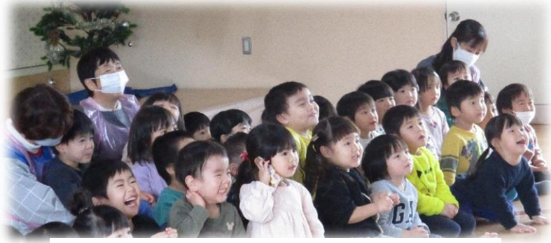
【↑エプロンさんの人形劇楽しかったね☆】

毎日寒いですが、子ども達は元気いっぱい遊んでいます。戸外では、おおかみとこやぎの追いかっこや、しっぽ取りゲームを楽しみました。保育者のしっぽを追いかけてたり、しっぽを取られないように逃げたり・・・いつの間にか体がぼかぼか暖かくなるほど、たくさん体を動かしました。三輪車乗りも上手になってきて、少しずつ自分の足で漕いだり、ハンドルを操作したりして、喜んで乗っていました。毎日、クリスマスの歌を歌ったり、絵本を見たりしながら、楽しみにしていた子ども達。保育所の電話が鳴ると「あっ！サンタさんかな！？」と、サンタが来ることをワクワクしながら待っていました。秋にお散歩で拾った木の実を使って、かわいいクリスマスリースも作りました♪おうちでも、楽しいクリスマスやお正月が過ごせるといいなと思います。