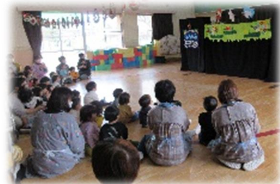
【↑エプロンさんのお話会】

まもなく、慌ただしい年末年始となりますが、体調に気を付けてよいお年をお迎えください!