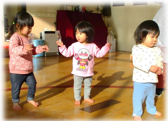
【→マラカス振ってダンス!】

12月は、こどもたちが体調を崩すことが多くなり、また、寒さが増して雪が降ったため、室内での遊びが多くなりました。クリスマスソングをかけると、ノリノリでマスカラを振ってダンスを楽しんでいました。ソフト積み木をステージや客席に見立てて上手に踊ってくれて可愛いらしかったです。