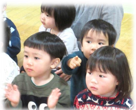
【↑エプロンさんの人形劇鑑賞→】

先日行われたお話し会では、エプロンさんの人形劇を見たり一緒に歌ったりして楽しむことが出来ました。知っている動物が出てくると「〇〇だねー」と指差ししました。お話会の最後にトトロのペーパサート