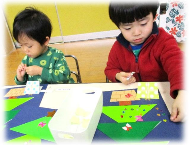
【↑「クリスマスツリー」の製作】

1月は寒い季節ならではの遊びを取り入れながら、寒さに負けずたくさん体を動かして遊んでいきたいと思います。