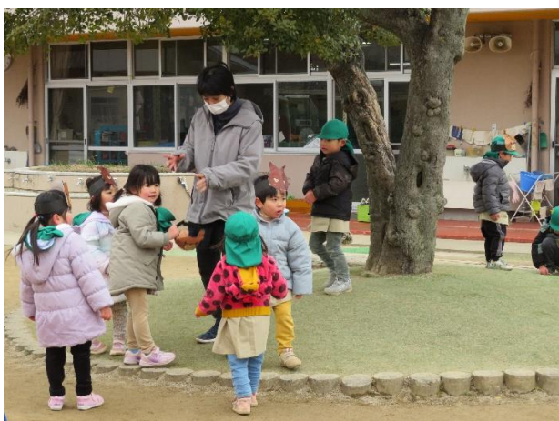
△ オオカミのお面をかぶって鬼ごっこをしています。