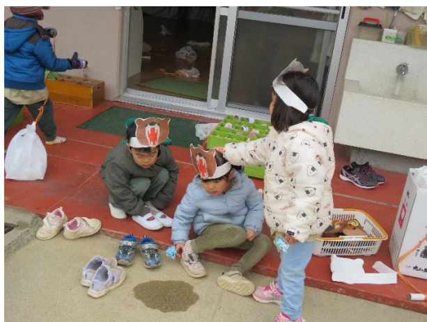
△ クマのお面をかぶって『むっくりクマさん』の鬼ごっこにまざるのかな。