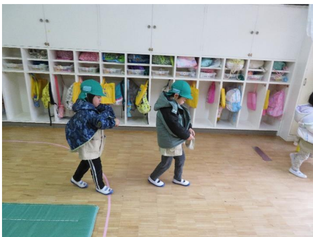
△防寒具を着て外に行くところです。