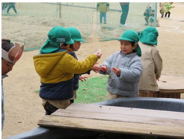
△ 氷を見つけて「つめたい!」「うすいね」と見せ合っています。