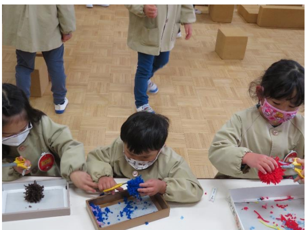
△ 何を作っているのかな。真剣に毛糸をカットしています。ハサミの使い方が上手です。