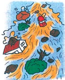
土石流のイメージイラスト