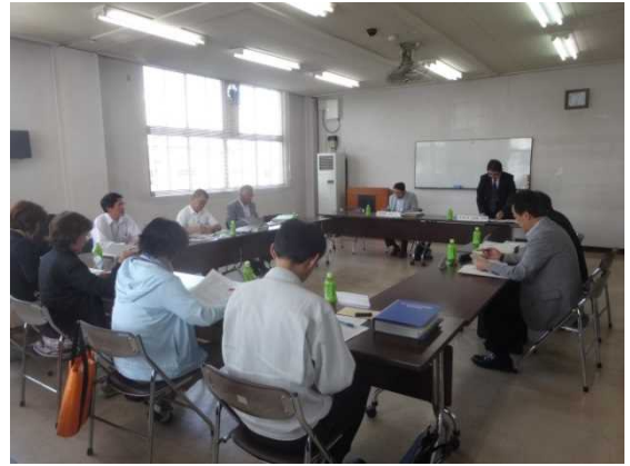
第6回委員会会議の様子

今回の会議結果を踏まえ、新庁舎に必要な具体的機能等についての更なる検討を行い、基本計画の策定を進めていきます。