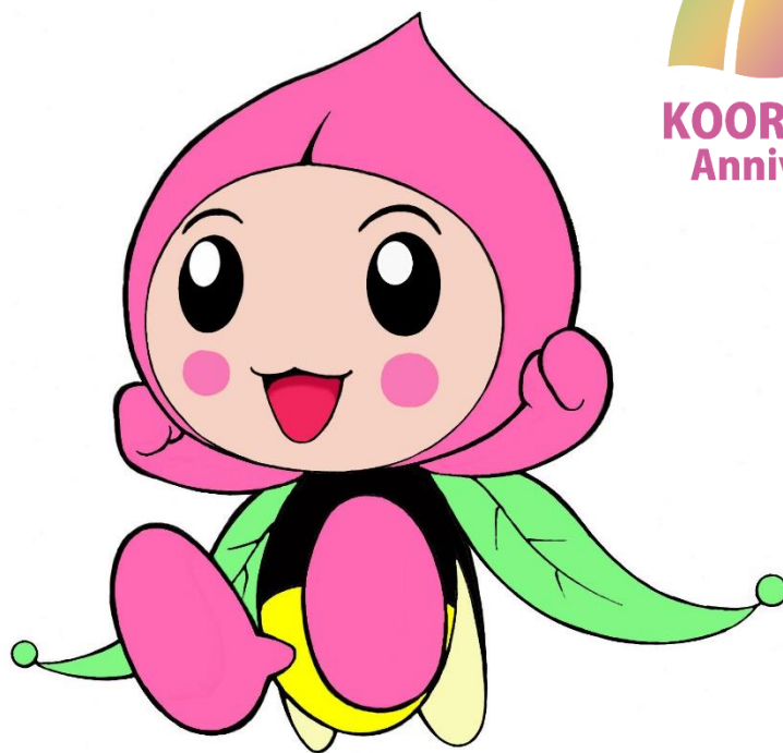
桑折町観光大使「ホタピー」