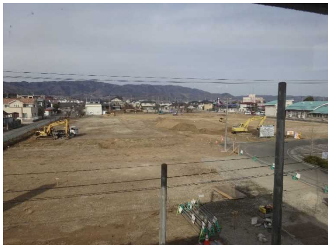
敷地全体(南側より)

新庁舎敷地について、開発許可を含む諸手続きが完了したことから、敷地造成工事を開始しました。盛土や切土等について、3月末までの完了に向け、整備を行っております。