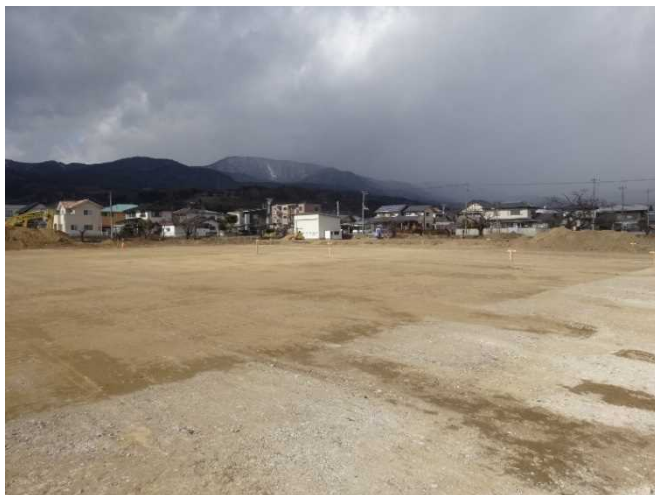
工事終了部分(東側より)