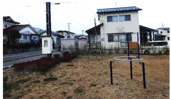
既存例：災害公営住宅内の公園 (この地下に調整池があります)

今後は、5月中旬頃より現地での作業を開始し、9月頃までに調整池の設置を終える見込みです。工事期間等については、次号以降で改めてお知らせいたします。