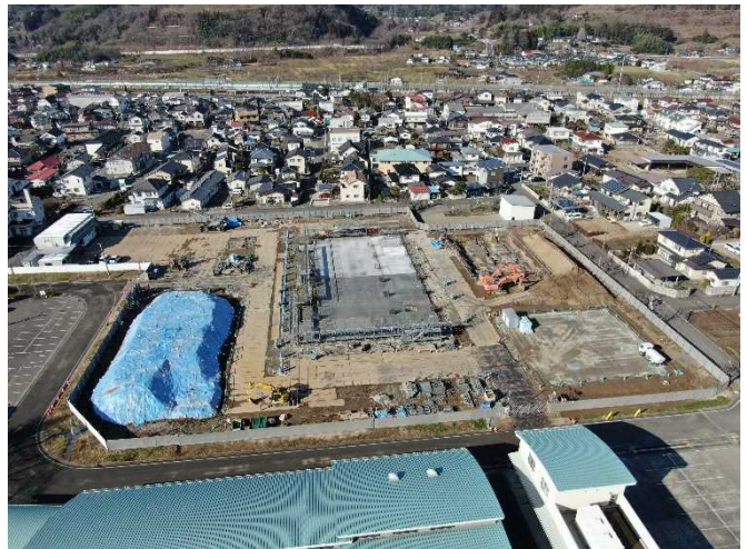
敷地東側より(12月基礎工事)