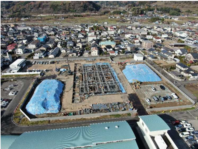
敷地東側より(11月下旬基礎工事)