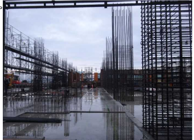
完成した1階床面上に、柱等の鉄筋を組立中