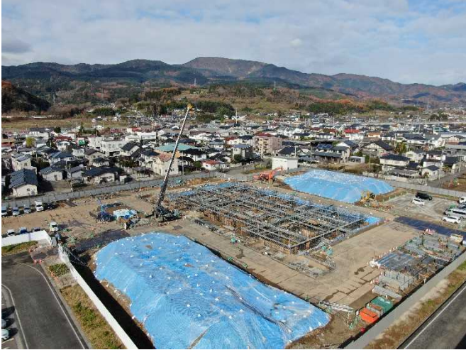
敷地南東側より(11月下旬基礎工事)

建築工事について建築事業者の(株)橋本店が実施している空撮の一部をご紹介します。