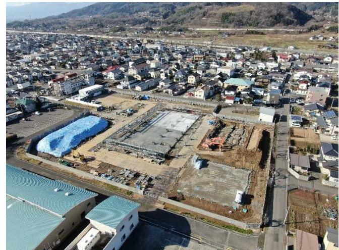
敷地北東側より(12月基礎工事)

撮影にあたっては、国土交通省より人口集中地区のドローン飛行許可・承認を受けた者(半沢・津田他)が、福島北警察署への事前連絡のもと、安全性やプライバシー等に配慮して実施しております。