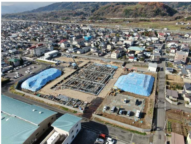
敷地北東側より(11月下旬基礎工事)