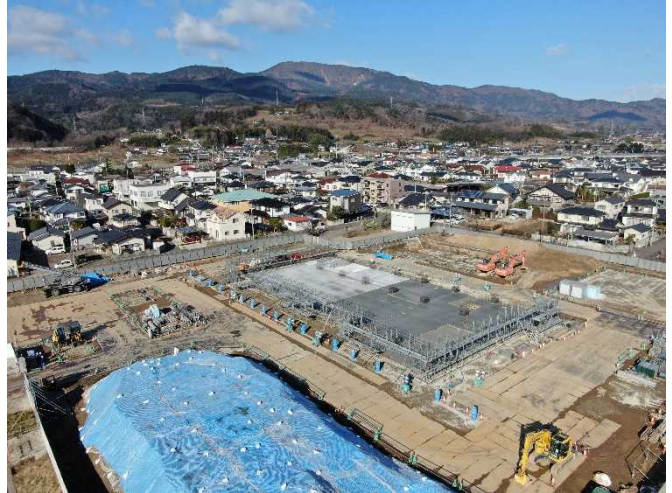
敷地南東側より(12月基礎工事)