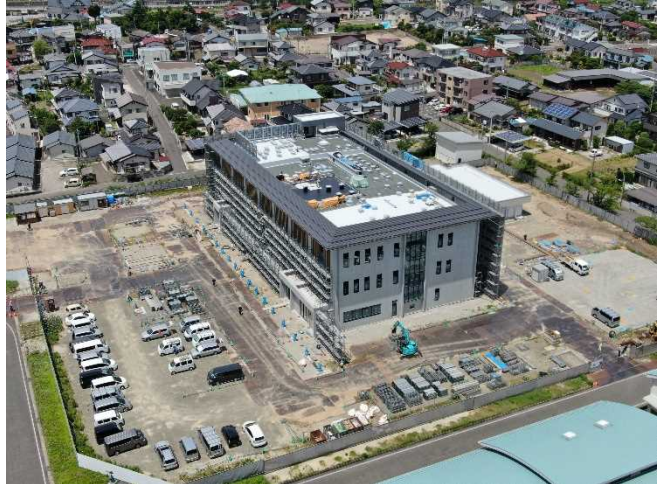
敷地南東側より(7月末内部外部仕上工事)

撮影にあたっては、国土交通省より人口集中地区のドローン飛行許可・承認を受けた者が、福島北警察署への事前連絡のもと、安全性やプライバシー等に配慮して実施しております。