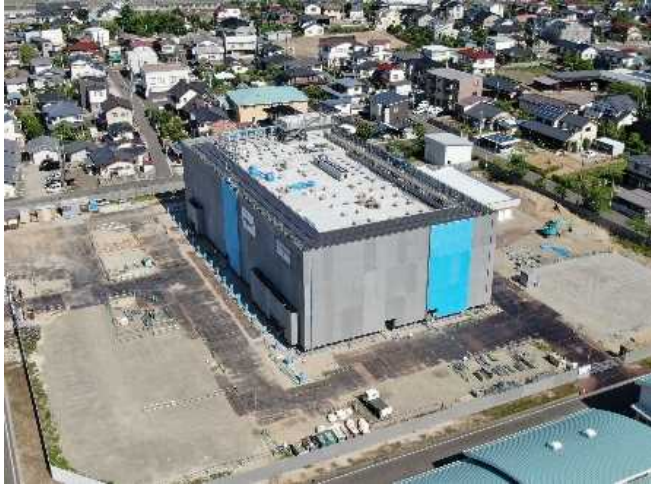
敷地南東側より(6月末内部外部仕上工事)