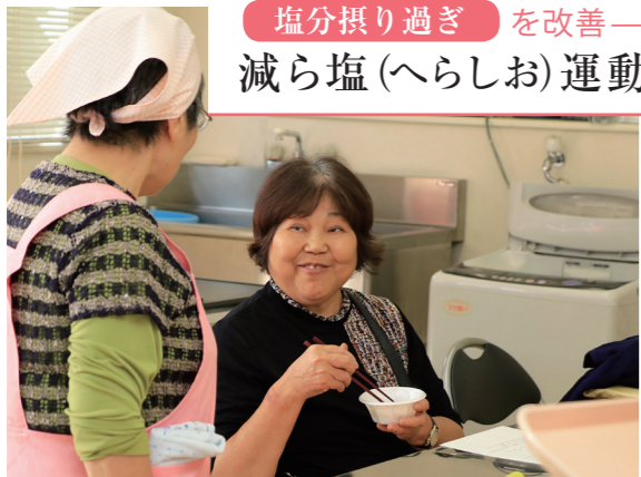
健診受診者に適切な塩分量の味噌汁を振る舞ってPR