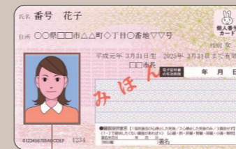
表 顔写真付き! 対面での本人確認書類

公的な本人確認書類です。マイナンバーの他に、氏名・住所・生年月日・性別が記載されています。