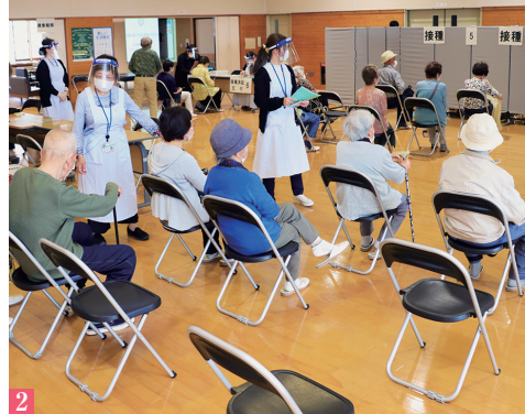
1_ 藤田総合病院の看護師が筋肉注射により腕へワクチンを打つ 2_ 感染症対策として、密にならないように人数制限を設けた会場