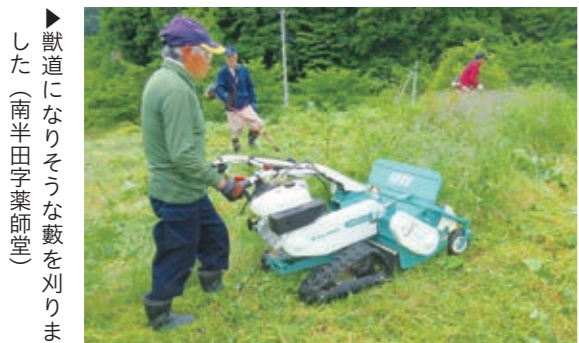
▶ 獣道になりそうな藪を刈りました（南半田字葉師堂）

町は、有害鳥獣対策として、鳥獣の隠れ場や獣道となる藪を適正に管理する町内会などの団体に、今年6月から「自走式草刈機（ハンマーナイフモア）」を無料で貸し出しています。