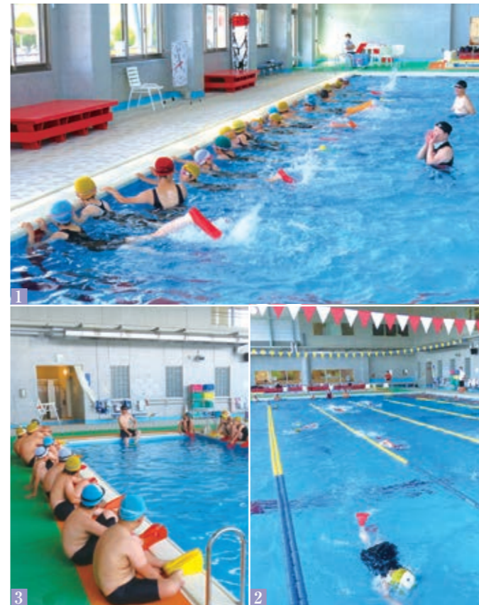
1_ フィンを着けて足首のしなやかさを習得 2_ フィンのおかげでいつもより楽に泳げました 3_ フィンの注意事項を聞く参加者