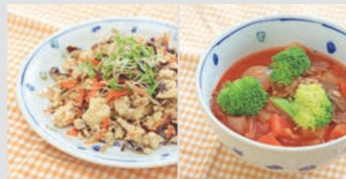
▲これまでの人気メニューを多数公開中です!

5月号に続き、「運動好きになる黄金期」について紹介します。前回は、「運動が好きになるか否かは、就学前に決まる」について掲載しました。今回は、具体的に就学前にどのようなことをすればいいのか、例を挙げて紹介します。 梅雨が明けて、思う存分外で遊べる時期がやってきました。熱中症にならないように、あまり暑くない時間帯を選んで、こまめに水分を補給したりして、たくさん戸外で遊びましょう。