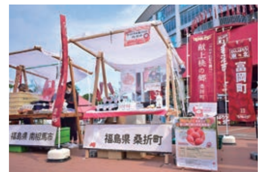
「桑折の桃大好きです」「また買います」と嬉しい声が続々と

ブースでは、至福の桃ソルベやグミなどの6次化産品を販売し、好評で瞬く間に完売しました。また、イベントに合わせ、選手の直筆サイン入りグッズや町産桃が当たるクイズキャンペーンも実施し、町の魅力を広くPRしています。