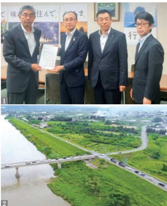
1_ 井出副知事（左）に要望書を手渡しました 2_ 右折車両が原因で、渋滞が発生しやすい伊達崎橋

同橋架け替えに向けた調査に着手する」との回答を得ました。 同橋は、1961年に架設。老朽化に加えて、幅員が狭いので歩道が無く、歩行者や自転車通行の際に危険が生じ、右折車両が原因で渋滞も発生しやすくなっています。円滑な地域間の交通と緊急輸送路の確保に向けて、早急な改修が望まれています。