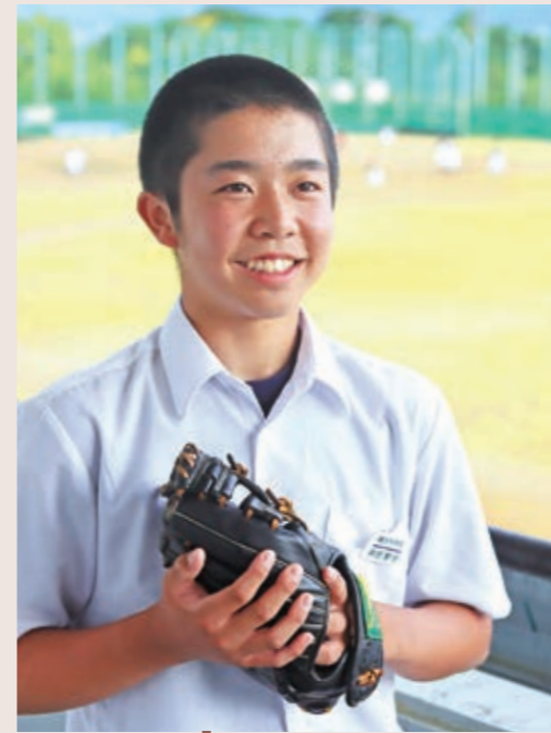
KAKU DATE KEIGO

中体連県北大会でベスト3、続く民報杯ではAブロックで優勝し、県大会出場を決めました。