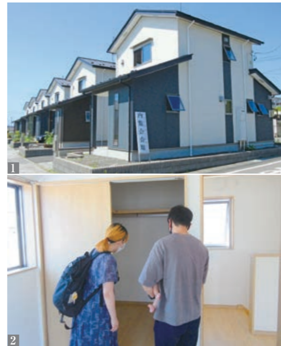
1_2階建て（3LDK）の子育て世帯定住促進住宅 2_内覧会で部屋の間取りや設備を確認する参加者

桑折駅前団地（東段地内、上郡字堰上地内）のうち7戸について、町への定住を希望する町内外の子育て世帯を対象に、6月から入居者募集を開始しました。 東日本大震災から10年経過し、桑折駅前団地の空き住戸が増加したことから、町が子育て世帯定住促進住宅（通称「スモーヨ」として供用しました。