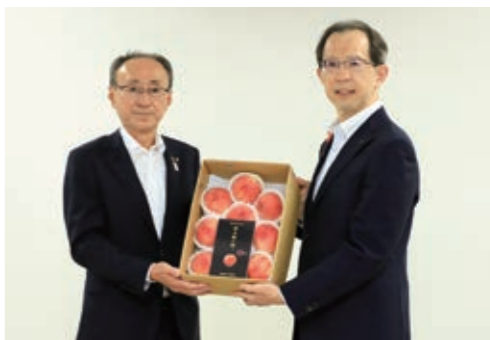
▶ 「香りも大きさも甘さも良く、ぜひいたくな味」と好評でした