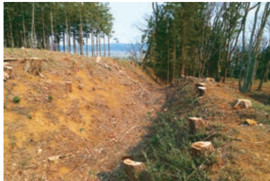
最大5mの深さがある大規模な中館・西館間の空堀