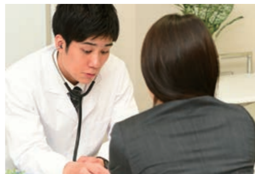
▲がん検診は、早期発見・早期治療のためにも、定期的に受けることが大切です

検診で精密検査が必要(要精検)という結果が出た場合、精密検査まできちんと受けることが重要です。治療が必要な状態であるにも関わらず放置した場合、病気が進行してしまう可能性があります。