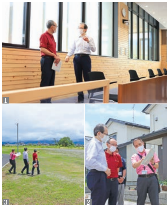
1_ 町産木材が使われた役場庁舎で意見交換 2_ 子育て住宅を視察 3_ 福島蚕糸跡地の整備予定について語る

ました。 続いて、今年1月に開庁した役場庁舎をはじめ、子育て世帯定住促進住宅と福島蚕糸跡地を視察。商業施設やグランピング施設などが整備される予定の福島蚕糸跡地では、町の魅力や暮らしやすさ、にぎわいを生み出す施策など、今後の事業の展望とまちづくりのビジョンについて意見交換を行いました。