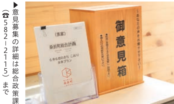
▶ 意見募集の詳細は総合政策課（☎582-2115）まで

総合計画案に対し、町内に在住・在勤する人や利害関係者の皆さんから意見を募集します。 ■ 募集期限 8月16日 ■ 提出方法 所定の様式に記入し、総合政策課へ郵送、FAX、メール、直接提出または「意見箱」に投函してください。