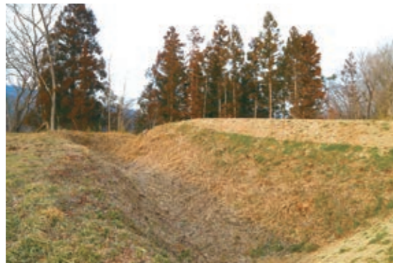
本丸と二ノ丸を仕切る空堀

10月30日、31日に開催される「全国山城サミット桑折大会」に向けて、桑折西山城跡の見所を連載で紹介していきます。第1回目は、西山城の「堀」です。 本丸と二ノ丸を仕切る空堀は、桑折西山城がある山の尾根が狭くなった部分に造られています。堀に沿って土塁が造られ、二ノ丸から本丸へは、空堀に土橋(土盛りした通路)を造り、出入りしていました。