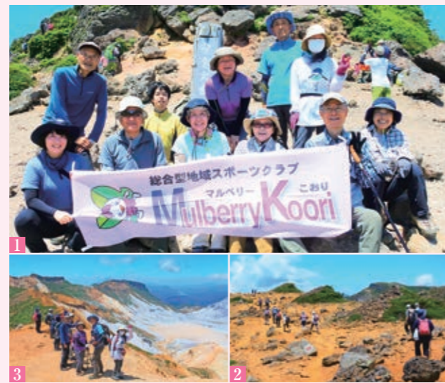
1_ 標高1700mの頂上で記念撮影 2_ 火山でできた荒々しい地形を堪能 3_ まるで月面世界のような絶景が広がります

次回は、10月に開催する予定です。詳細が決まりましたら、チラシなどでお知らせします。