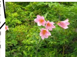
ヒメサユリ (6月上旬～6月中旬)