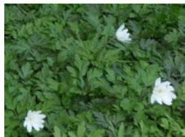
キクザキイチゲ (4月～5月)