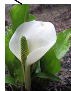
ミスバショウ (4月～6月)