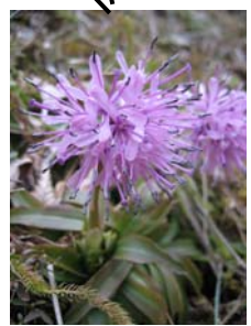
ショウジョウバカマ (4月上旬～4月下旬)