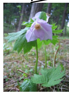
シラネアオイ (5月上旬～5月下旬)