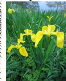
キショウズ (6月上旬～6月下旬)