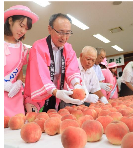
皇室に献上する桃を決める「選果式」