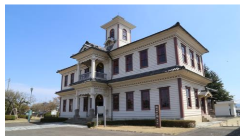
旧伊達郡役所（国指定重要文化財）