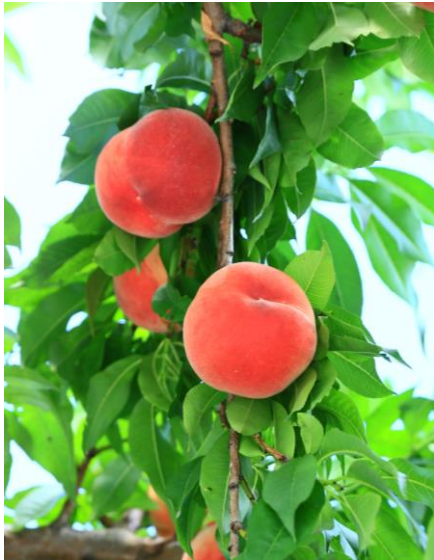
町の特産品「あかつき」

そこで本町では、産地を維持・継承するため町内の桃生産者のもとで栽培技術を学び、「献上桃の郷 桑折町」でしか作れない、全国に誇れる極上の桃の生産者となることを目指し、町農業活性化に尽力することに意欲のある地域おこし協力隊を募集します。