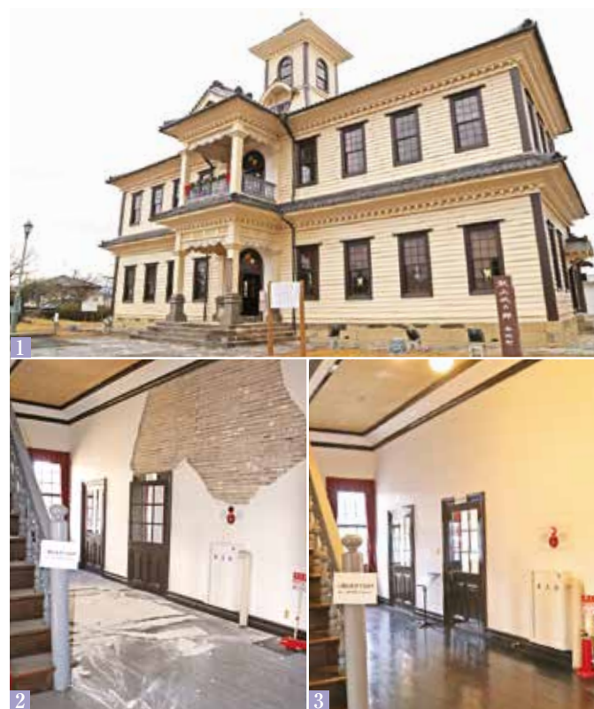
1_リニューアルした旧伊達郡役所。開館時間は9:00～17:00（月曜定休）2_崩れた内壁 3_塗り直してよみがえる内壁

今年10月に築140年を迎える「旧伊達郡役所」。明治時代の和風の意匠もある貴重な擬洋風建築をぜひお楽しみください。