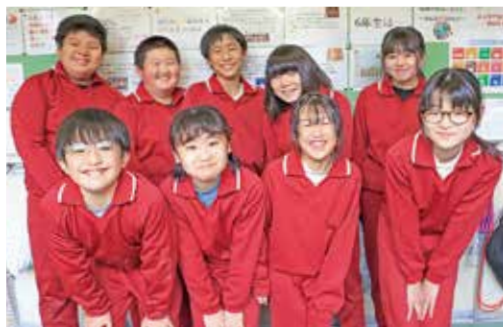
SDGs推進リーダーを務める6年生の皆さん

睦合小学校では、「卒業プロジェクト」と題し、6年生が推進リーダーとなってSDGsに取り組んでいます。委員会活動の一環として、節電や節水に努め、世界で起こる環境問題や戦争、福祉について学習するほか、各学年ごとに具体的な活動目標を掲げ、全校生一丸となってSDGsを推進しています。小学校生活最後の年に、お世話になった学び舎や町への恩返しの気持ちとして、心を込めてできることに取り組み、下級生へSDGsのバトンをつないでいます。