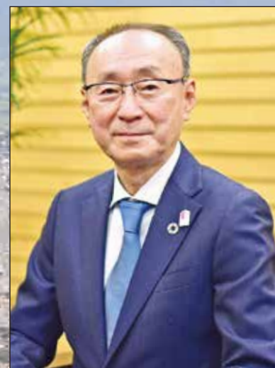
桑折町長 高橋宣博