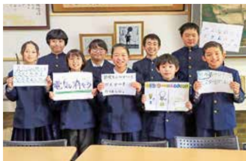
環境委員が中心となり、工夫して取り組んでいます

伊達崎小学校では、工夫を凝らした独自の取り組みが盛んです。例えば、絶滅危惧種や海の生き物の生態を調べ、絵を描くことで理解を深める「SDGsイラスト大会」や、学校外でもSDGsに取り組むべく、家庭や地域の資源回収で空き缶のプルタブを集め、収益金を町の福祉活動のために寄附しています。他にも、男女差別をなくそうと、性別に関係なく、全員を「さん」付けで呼び合うなど、自分たちでアイデアを出し合い、積極的に取り組んでいます。