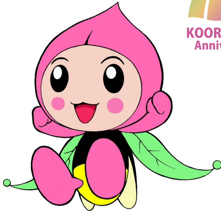
桑折町観光大使「ホタピー」