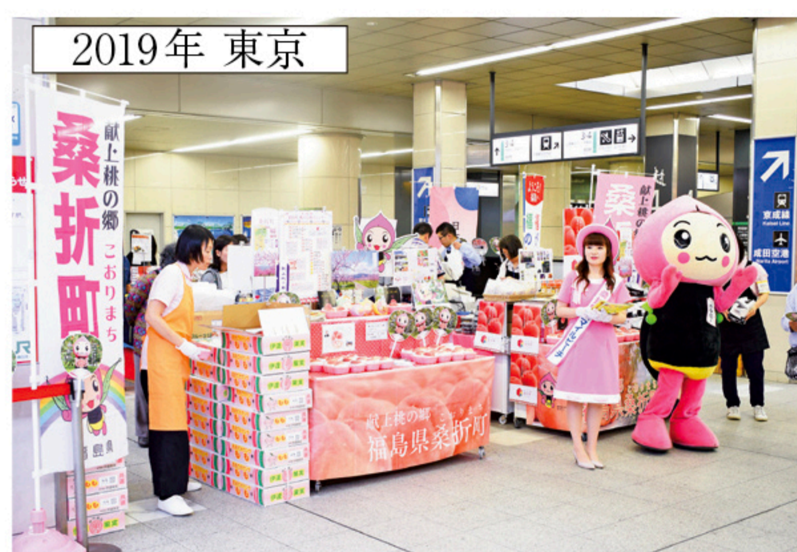
▲関東圏では2019年以降のPRに

関東圏ではなんと7年ぶりの物産フェア。有楽町ビックマルチビジョンのPR動画と合わせて、町をアピールしてきます。