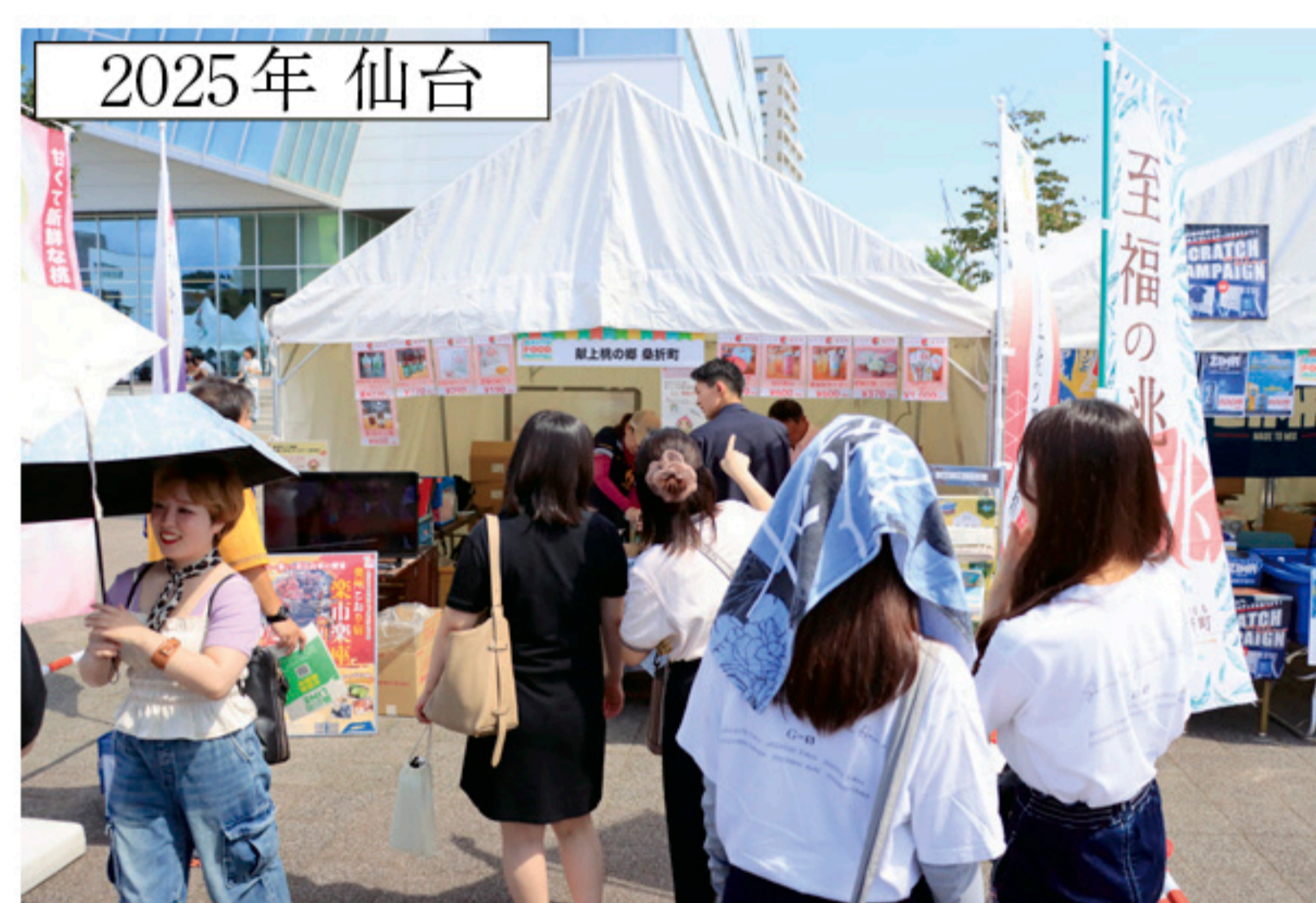
▲昨年仙台長町で行った物販の様子