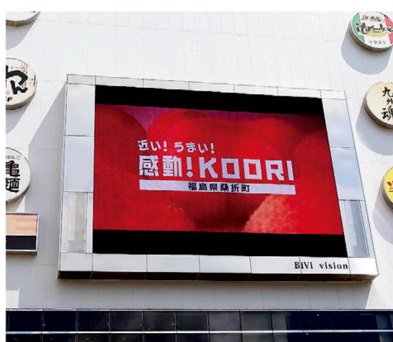
▲昨年も仙台BiViビジョンでPR動画を流しました