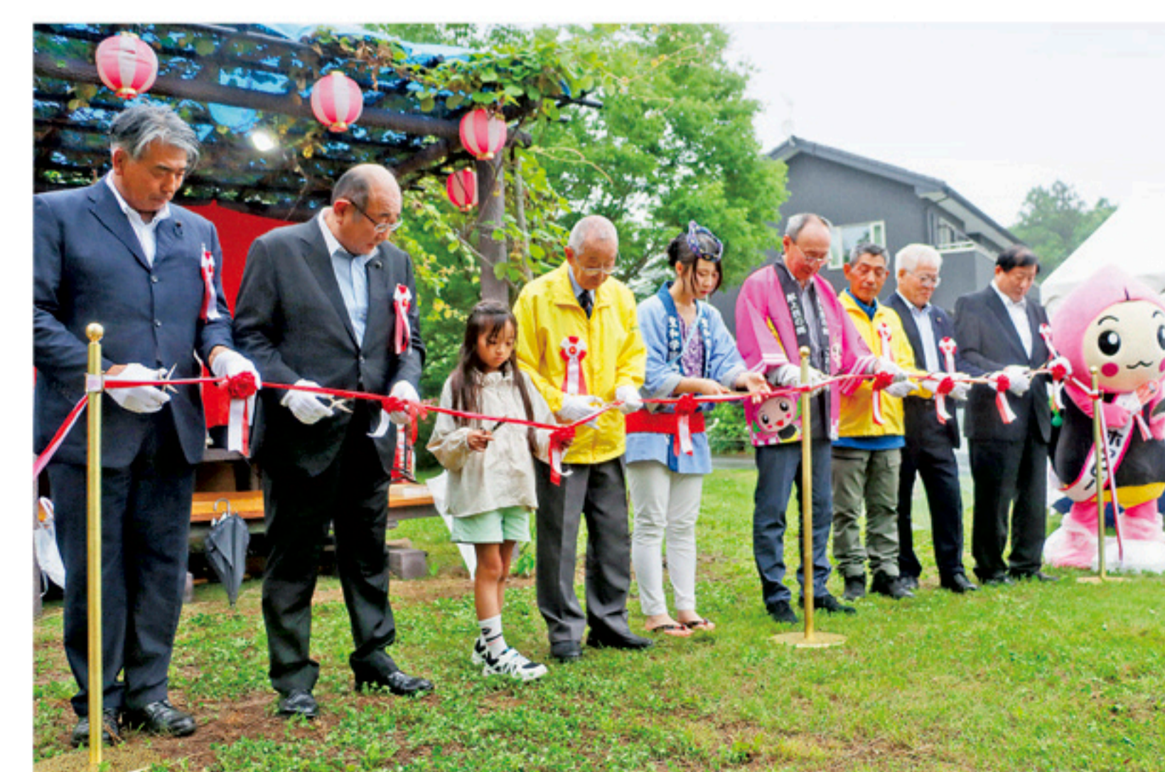
▲今年のホテルまつりの様子 ※8月号で特集予定