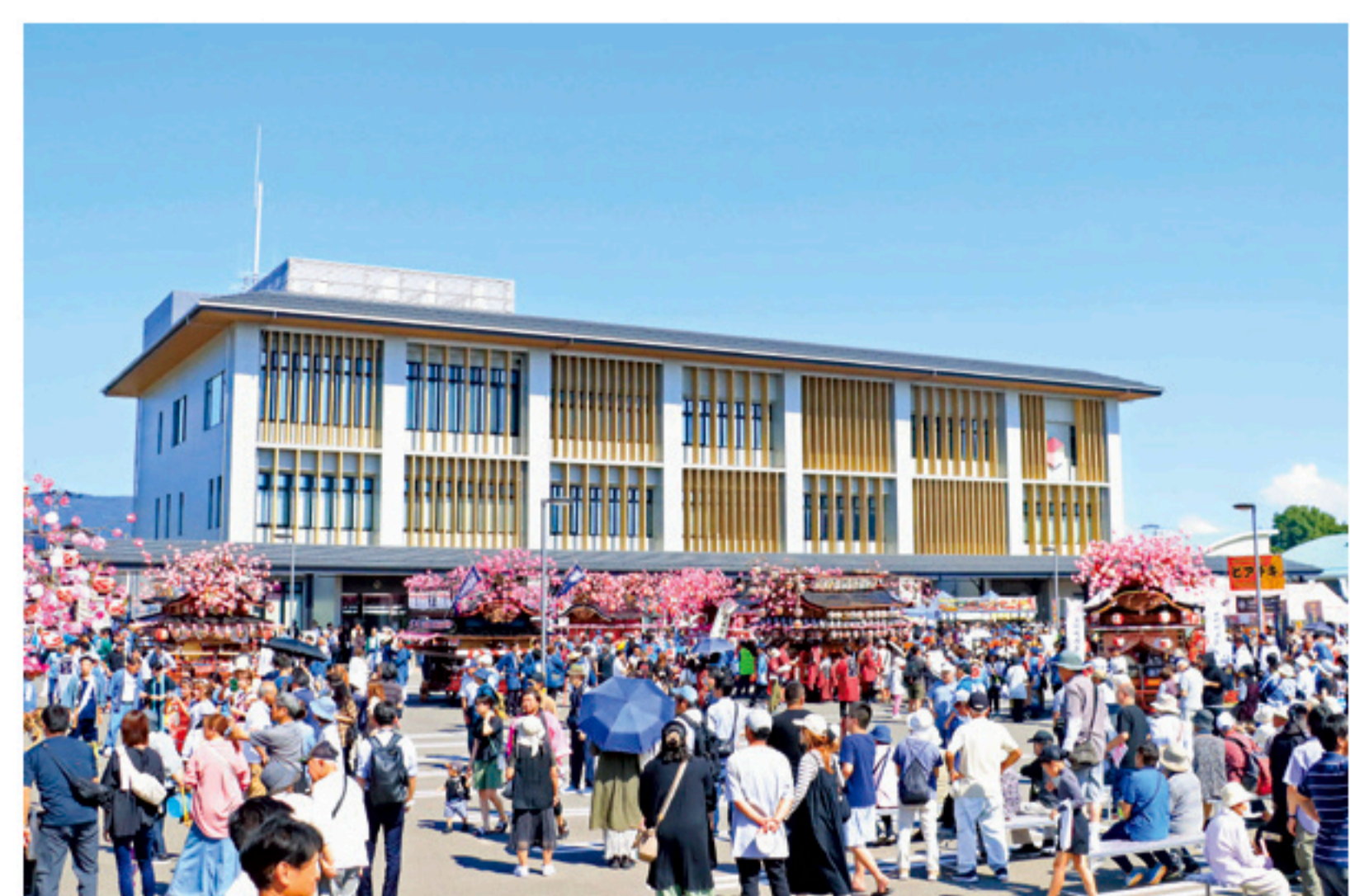
▲昨年の奥州こおり宿楽市楽座in山車フェスの様子