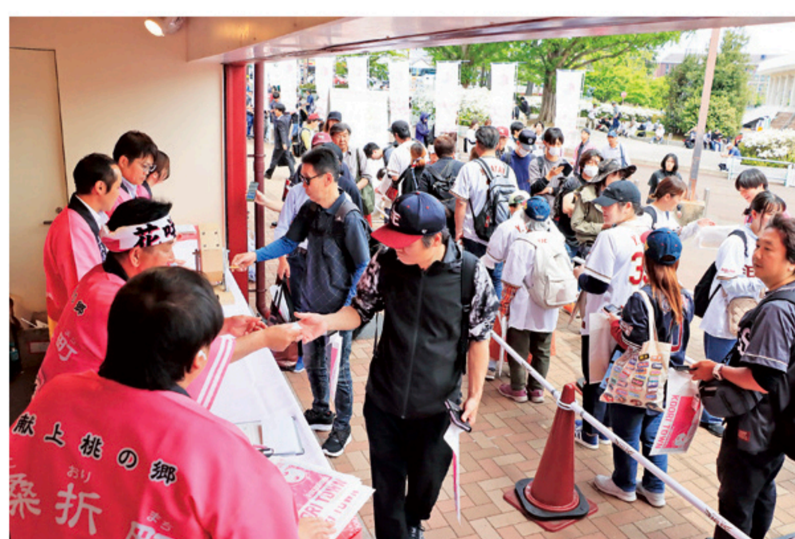
▲昨年の桑折町デーでは多くの来場者がブースに訪れました